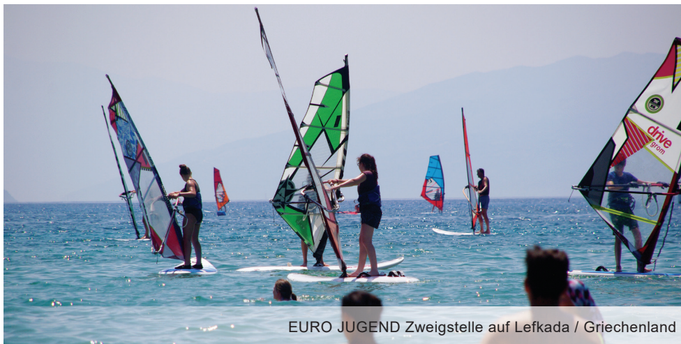
EURO JUGEND Zweigstelle auf Lefkada / Griechenland

Wochenendcamps, Ferienspiele, erlebnispädagogische Camps und Fortbildungen sind weitere Angebotsformen für Kinder, Jugendliche, junge Erwachsene und pädagogische Fachkräfte.